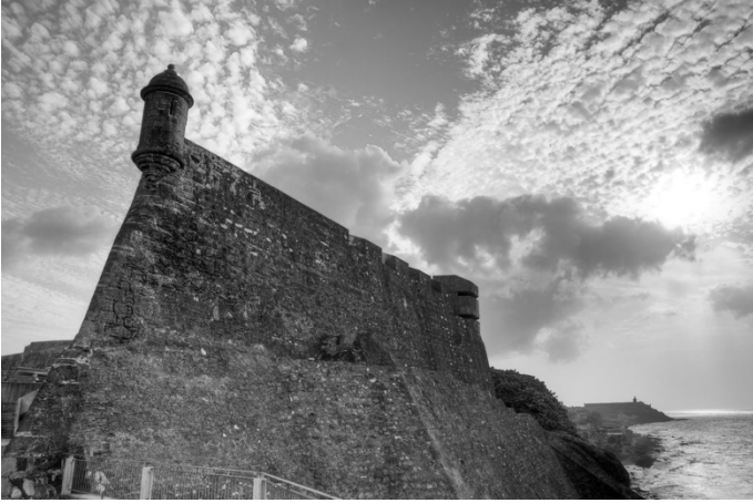
El Castillo San Cristóbal. San Juan, Puerto Rico.