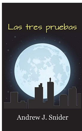
Las tres pruebas